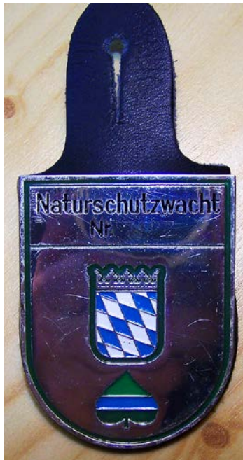
Abb. 2: Dienstabzeichen der Bayerischen Naturschutzwacht (Foto: Heinz Unsöld).

In einigen Fällen sind Erholungssuchende auch auf unzulässige offene Feuerstellen oder die Handstraußregelung hinzuweisen. Vermehrt sind auch ein- und mehrspurige Motocross-Fahrzeuge anzutreffen. Diese können nicht nur Spaziergänger gefährden, sondern sind in Schutzgebieten in der Regel auch nicht mit der Schutzgebietsverordnung vereinbar. Da die Einsatzbereiche häufig vor