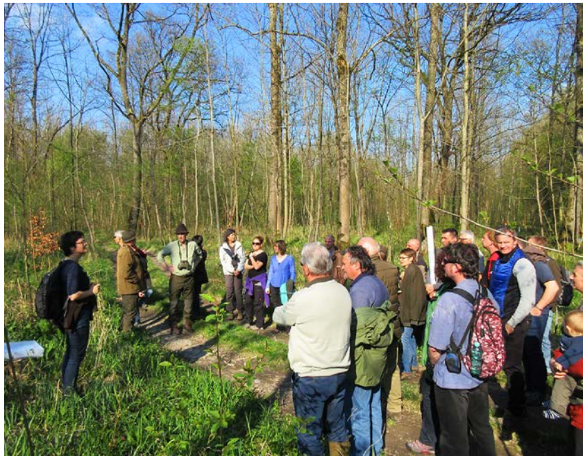
Abb. 3: Die ökologische Bedeutung der Salzachau. Exkursion im Rahmen der Naturschutzwachtausbildung 2016.

Um die vielfältigen Aufgaben eines Naturschutzwächters oder einer Naturschutzwächterin wahrnehmen zu können, werden die Anwärter an der Bayerischen Akademie für Naturschutz und Landschaftspflege (ANL)