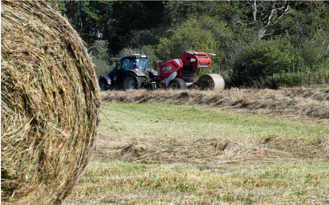
Abbildung 1: Ein Landwirt presst Heu- ballen aus Landschafts- pflegegras auf einer Nass- wiese.