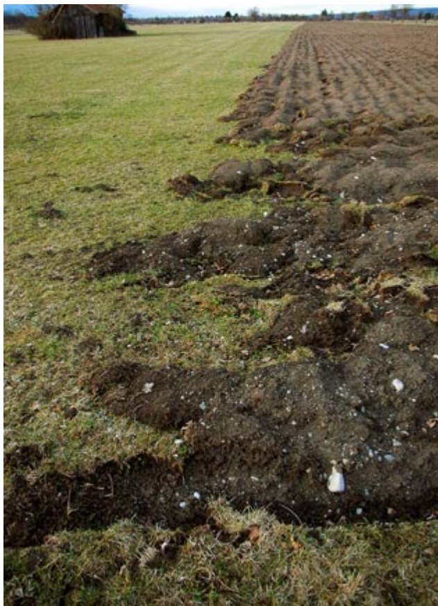
Abb. 3: Grünlandumbruch im bayerischen Voralpenland.

Hintergrund des Umbruchverbots sind die Regelungen zur EU-Agrarreform, die Cross Compliance-Regelung. Darin ist vorgesehen, dass der Umbruch von Dauergrün-