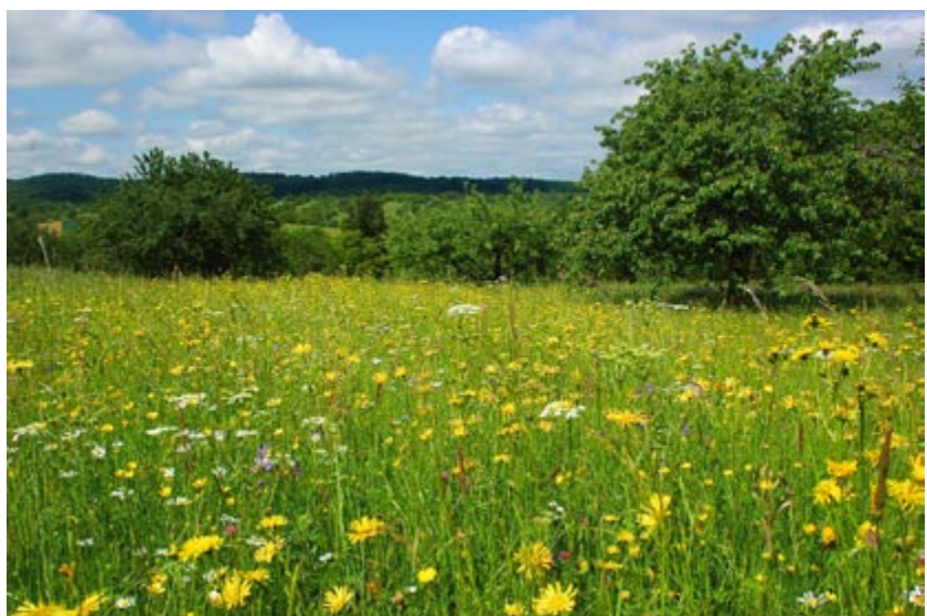
Abb. 1: Lebensraumtyp 6510 Flachland-Mähwiese des Anhang 1 der FFH-Richtlinie am Albtrauf in Baden-Württemberg.

Kommt kein freiwilliger Vertrag zustande oder ist der Grünland-Lebensraumtyp unwiederbringlich zerstört (beispielsweise durch Umbruch, Neueinsaat und Überdeckung), kann die Wiederherstellung einer FFH-Mähwiese angeordnet und zusätzlich ein Bußgeld erhoben werden, sofern der Verlust des FFH-Lebensraumtyps dem Bewirtschafteter angelastet werden kann. Ein Bußgeld kommt